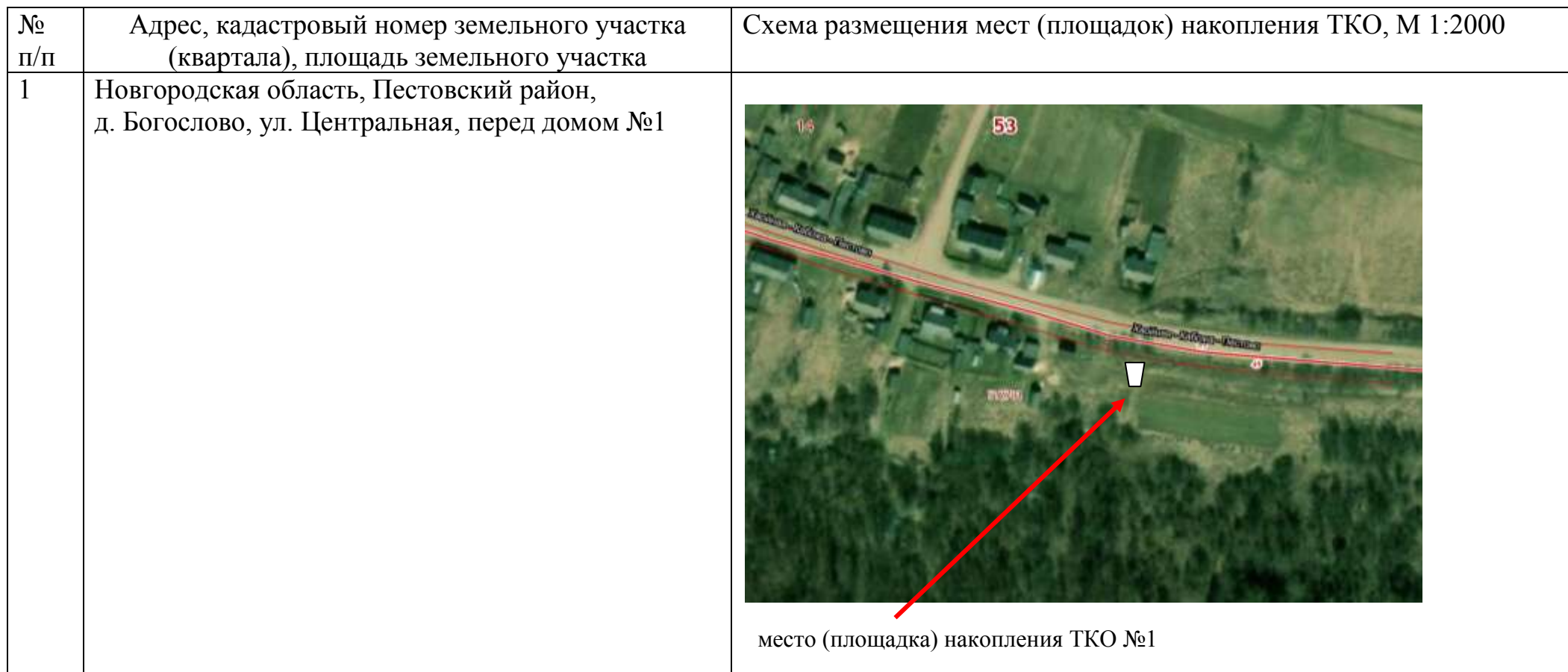
Схема размещения мест (площадок) накопления твердых коммунальных отходов на территории Богословского сельского поселения.

Утверждена постановлением Администрации Богословского сельского поселения от 08.02.2021 № 5